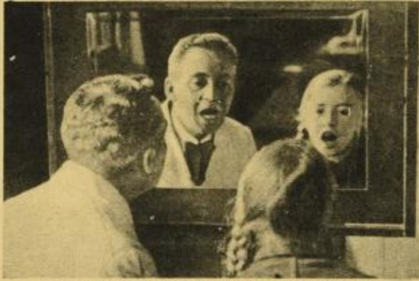
In der Sprachheilchule lernt das Kind mit Hilfe des Lehrers seine Sprachbewegungen vor dem Spiegel beachten