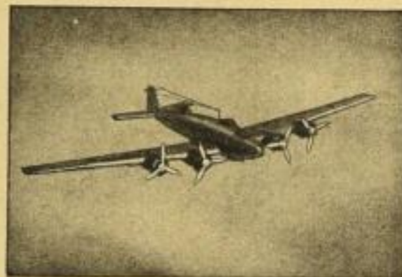
Fernbomber „Focke-Wulf Kurier“

Bisher sind folgende Baupläne erschienen: