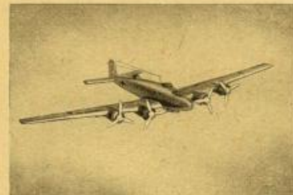
Fernbomber „Focke-Wulf Kurier“

Bisher sind folgende Baupläne erschienen: