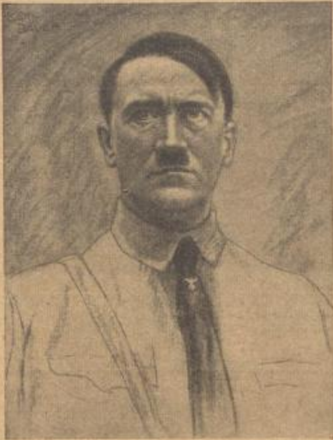
Prof. Karl Bauer, Hitler

P.K. 19 Dreifarbiges Lichtdruck RM 6.— Bildgröße 58 x 45 cm, Papiergröße 75 x 55 cm