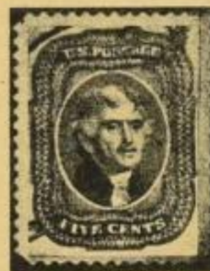
U. S. 1851. 5 cents Thomas Jefferson

„Eine Vergiftung der Mächte Europas untereinander fördert die Sicherheit Amerikas und seine ungestörte Ausbreitung.“ Ausspruch des 3. Präsidenten Jefferson a. d. Jahre 1812.