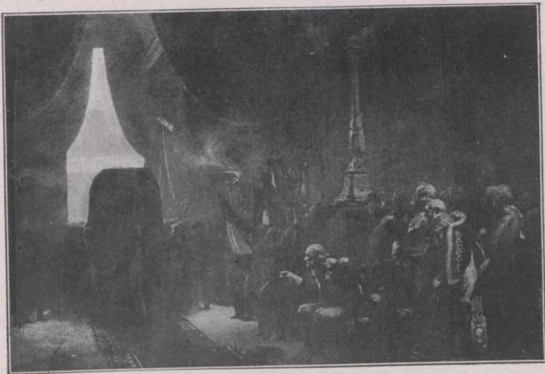
ROUSSEL (G.-F.). L'Empereur! entrée des cendres de Napoléon I er dans la chapelle des Invalides (15 décembre 1840). The Emperor! Depositing the remains of Napoleon I in the "Invalides".