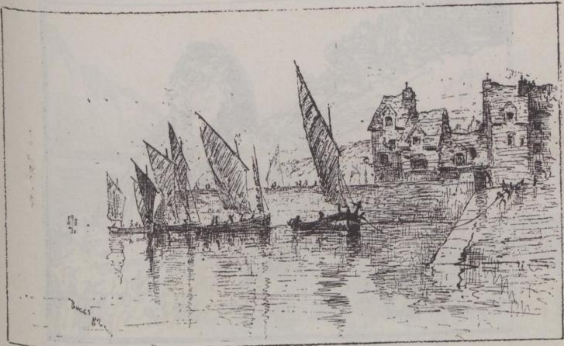
BOGGS (F. M.). Entree des bateaux de pêche (Dieppe). — Arrival of fishing-boats