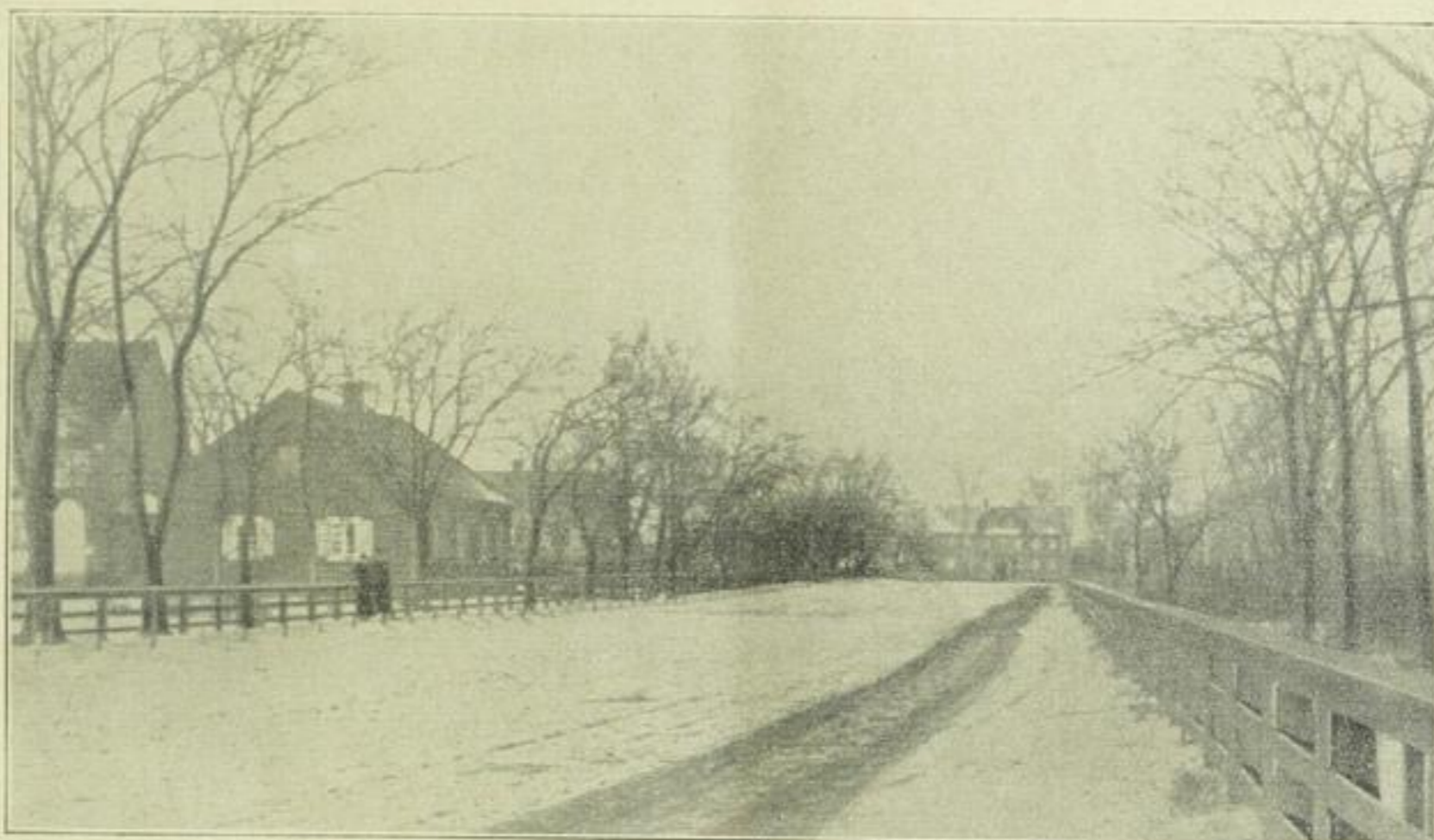
Ein wolgadeutsches Dorf: Köppental

derung der ASSR der Wolgadeutschen. Die drei Jahre des Bestehens der Wolgadeutschen Sowjetrepublik liefern den Beweis, daß ihre junge Regierung sich der Verantwortung würdig gezeigt hat, die sie vor der Bevölkerung des Wolgadeutschen Gebietes und der ganzen Sowjetunion übernahm. Der Vorkriegszustand der Wirtschaft ist im großen und ganzen nahezu wiederhergestellt, ein weiterer Aufschwung ist im neuen Jahr zu erwarten, so daß man an der Wolga mit Zuversicht der Zukunft entgegen sehen kann. Auch die