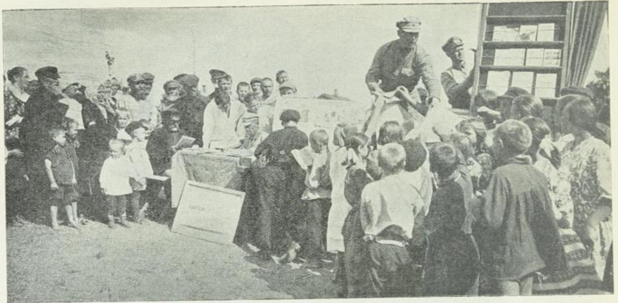
Bücherausgabe auf dem Dorfe durch die Rote Armee

stärken. In Moskau wird man die Verteidigungswoche mit einem Volksfeste grandiosen Ausmaßes draußen bei den Flugplätzen, auf dem „Oktoberfelde“ abschließen: dreihunderttausend Billette sind dafür verteilt, Kinos und Lautsprecher aufgebaut, ein Dutzend Theaterbühnen werden improvisiert, und alles wird gekrönt durch eine Parade der Schützen-, Gasmasken- und Sanitätsabteilungen der Ossoawjachim und durch ein Kriegs-