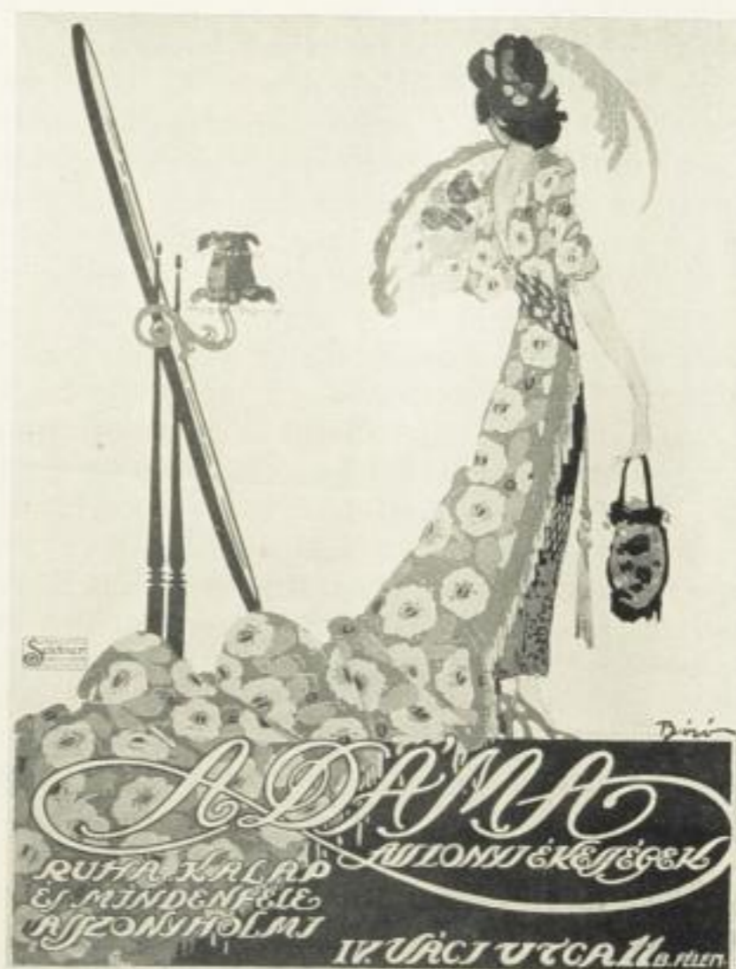
Michael Biró Abb. 7 Plakat Druck: Seldner, Budapest