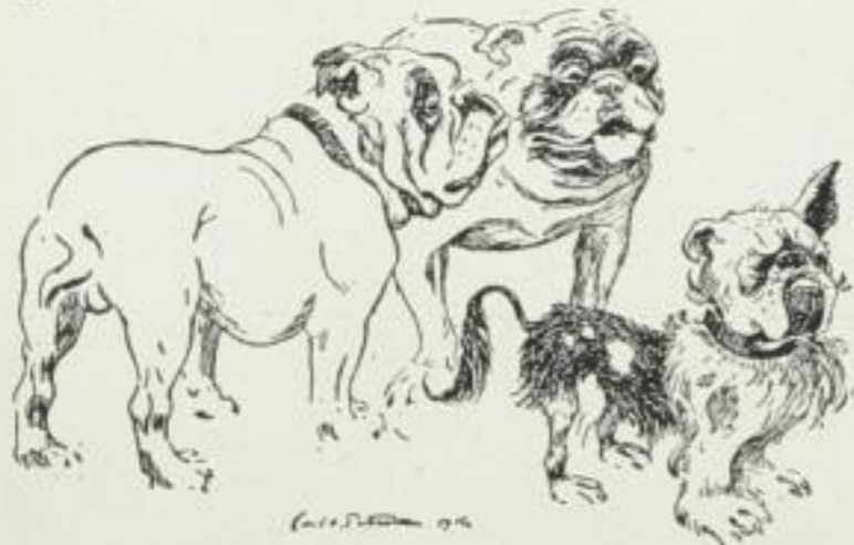
„Ich bitte sehr um Entschuldigung, aber man hat feinerzeit nicht genügend auf meine Mama aufgepaßt.“