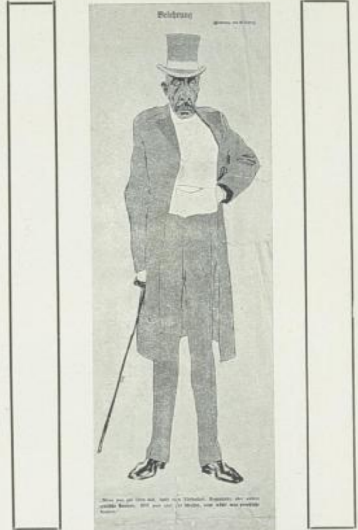
(V.) E. Thöny Zeichnung Abb. 34