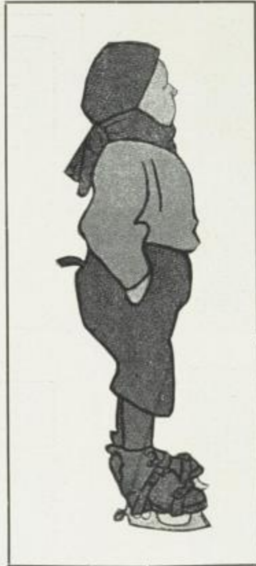
(V.) O. Gulbransson, Zeichnung 1909 Abb. 33