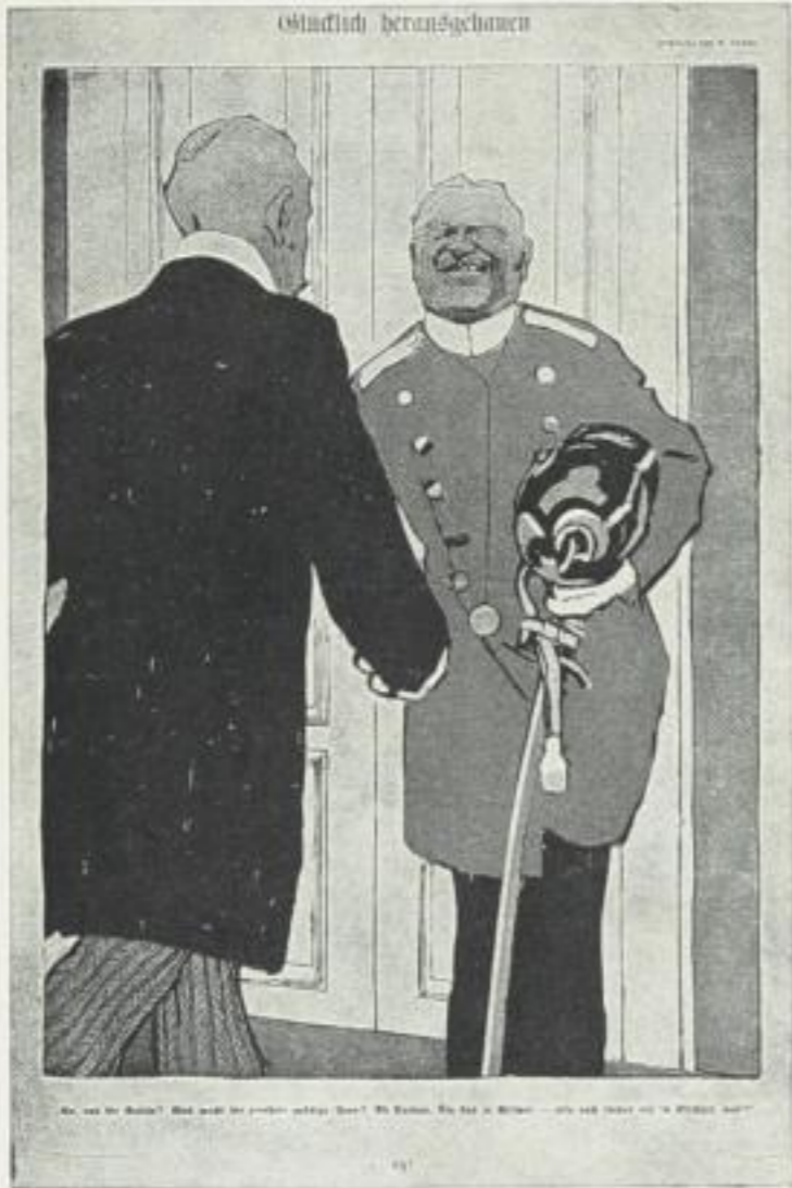
(V.) E. Thöny Zeichnung Abb. 32