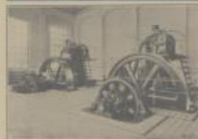
24 100 PS Deutscher Teeröl-Dieselmotor in der Oberkesselbauanstalt Grödenhain C. B.