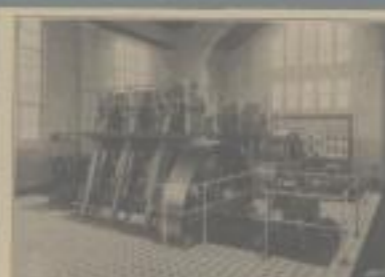
2 Deutscher Teeröl-Dieselmotoren von 24 300 PS im Detailfabrikwerk Sauerbrunn