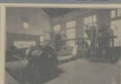
24 200 PS Deutscher Teeröl-Dieselmotor im Zentralfabrikwerk Mayen

Deutscher Teeröl-Dieselmotoren arbeiten mit billigen Steinkohlenteerölen aus Kokereien und Gasanstalten. Brennstoffkosten nur ca. 1 Pfg. für die Pferdekraft-Stunde.