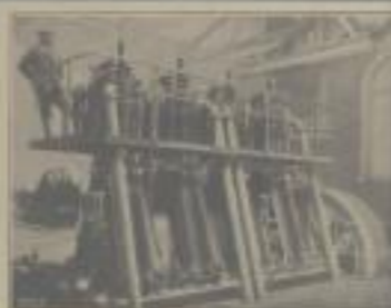
1400 PS Deutscher Dieselmotor der 1100er-Linie in stehender Bauart in einer Fabrik