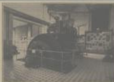
4000 PS Deutscher Teeröl-Dieselmotor in einer vertikalen Bauart