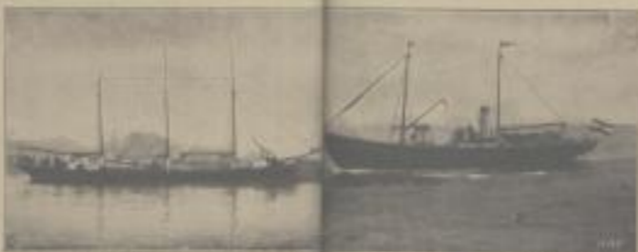
Frachtdampfer „Athen“ mit 24 100 PS Deutscher Teeröl-Dieselmotoren und die Bootschiffen „Auffall“ mit 14 100 PS Deutscher Schiff-Dieselmotoren

Deutscher Teeröl-Dieselmotoren arbeiten mit billigen Steinkohlenteerölen aus Kokereien und Gasanstalten. Brennstoffkosten nur ca. 1 Pfg. für die Pferdekraft-Stunde.