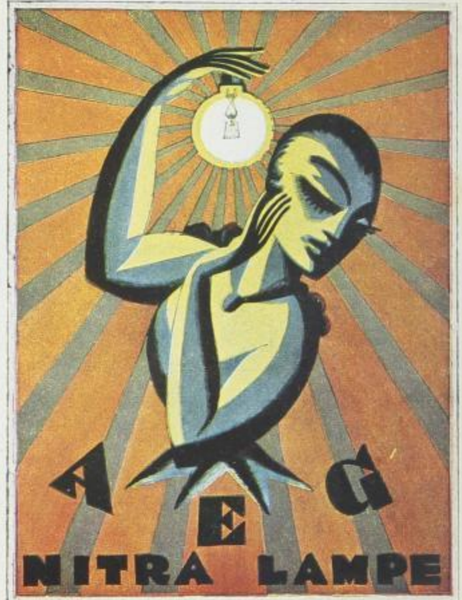
MAX SCHWARZER, MÜNCHEN