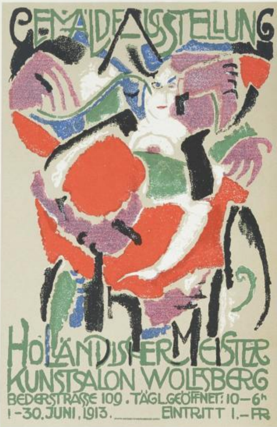
J. Sluyters, Plakat. Druck: J. E. Wolfensberger, Zürich.

Druck der Beilage: Lithographische Kunstanstalt M. DuMont Schauberg, Köln am Rhein.