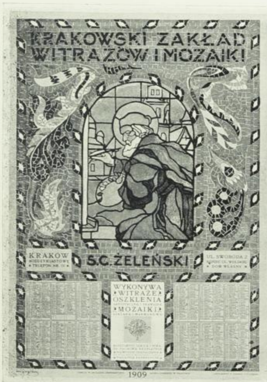
JAN BUKOWSKI ABBILDUNG 6 KALENDERPLAKAT 1909 Druck: Uniwersitätsdruckerel, Krakau

OTWARTA 10 WRZEŚNIA OD 9 ZRANA DO 8 WIECZÓR WSTĘP 1 KOR