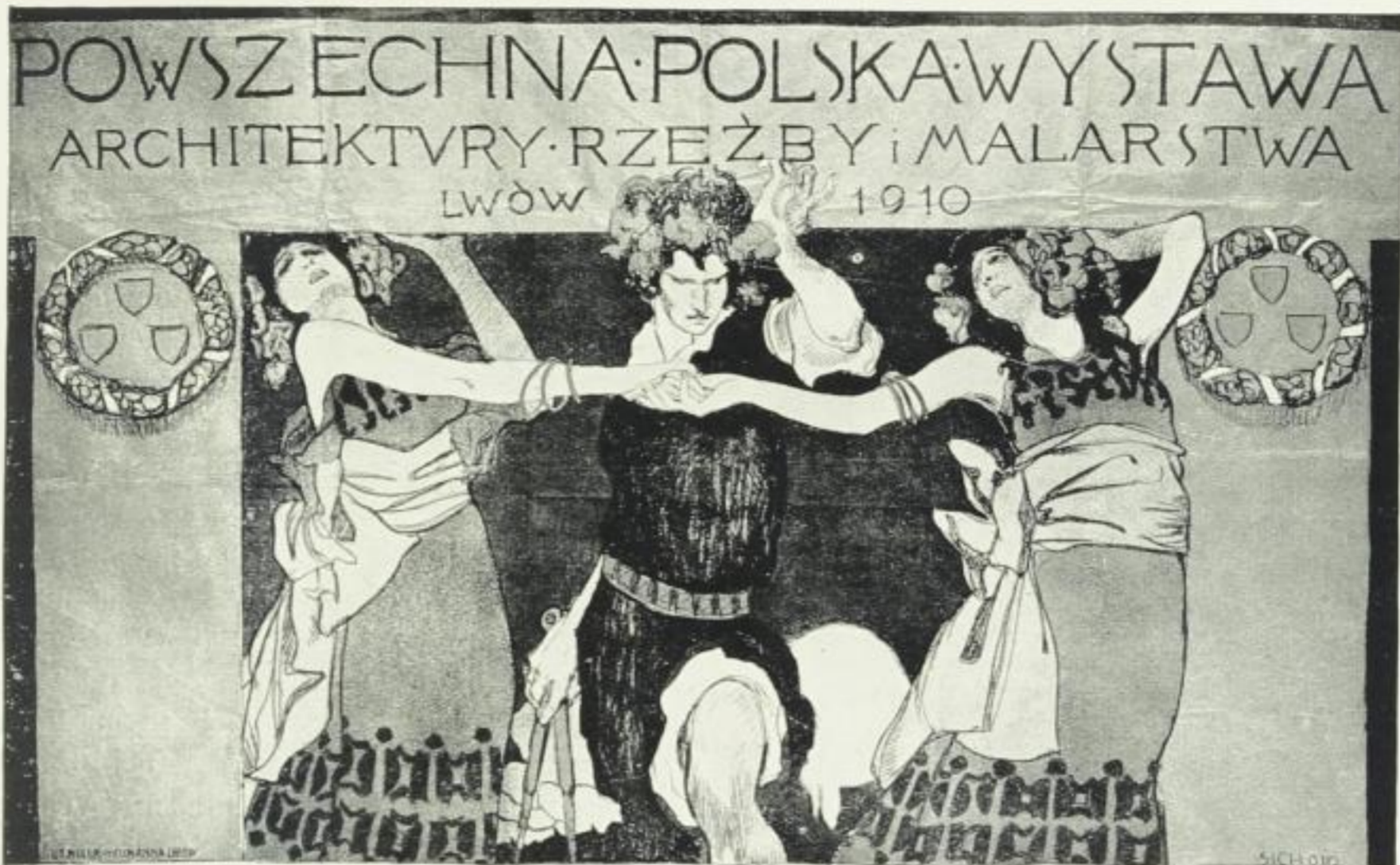
ABB. 5 SICHULSKI PLAKAT 1910