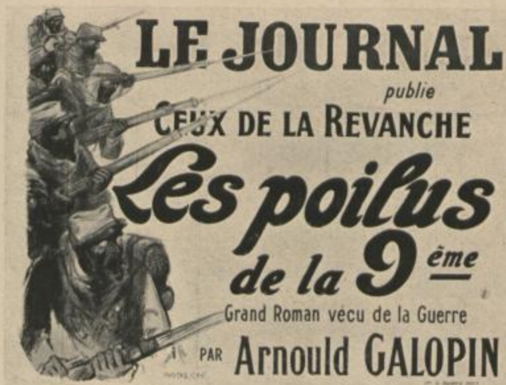
MAITRE JEAN ABBILDUNG 30 PLAKAT Druck: G. Dupuy, Paris