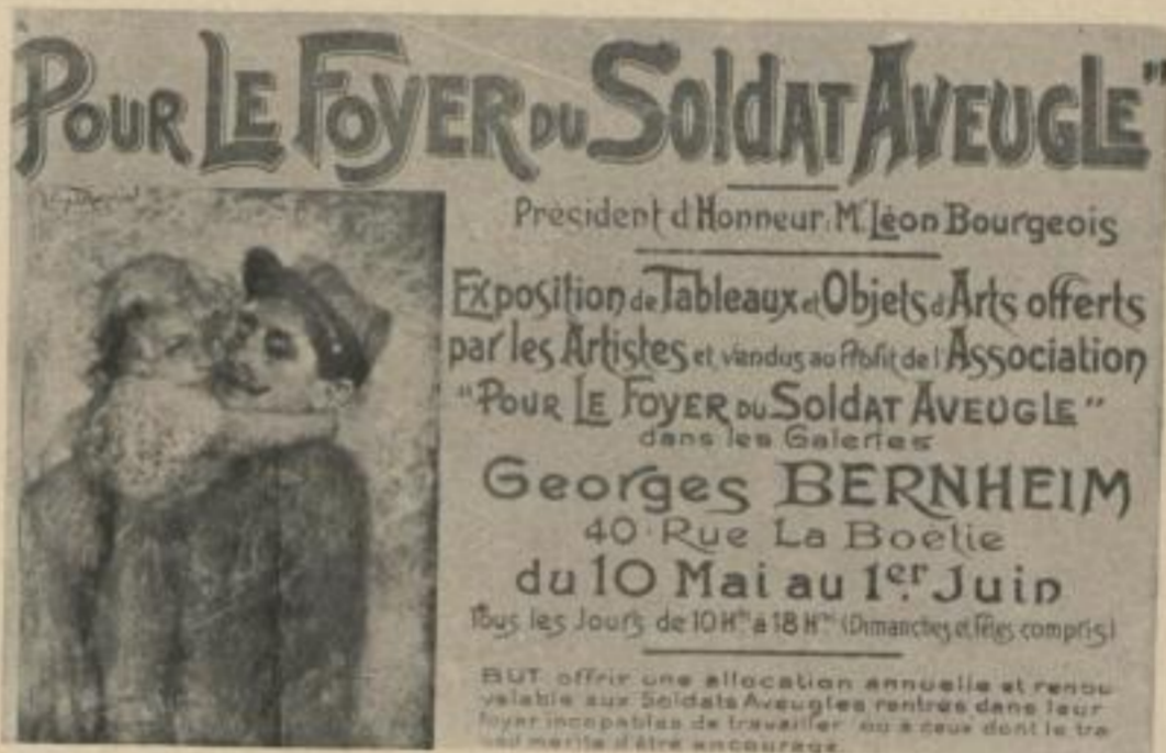
LÉVI-DHURMER ABBILDUNG 31 PLAKAT Druck: L. Marotte, Paris