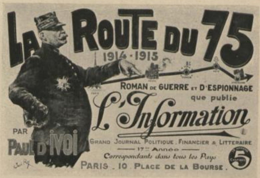
JOSÉ ROY ABBILDUNG 32 PLAKAT Druck: Imprimerie spéciale, Paris