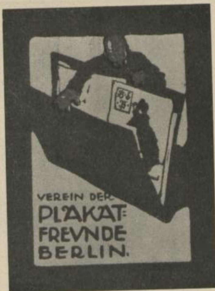
V F. A. Pfeffer Umschlag- Entwurf

Diese Zeichnung übt eine beson- dere Anziehungs- kraft auf die Plagiatoren aus! Die oben rechts stehende Arbeit haben wir schon in der ersten Folge (Abbildung 38) veröffentlicht, in- zwischen haben wir den unten- stehenden Fall aufgefunden.