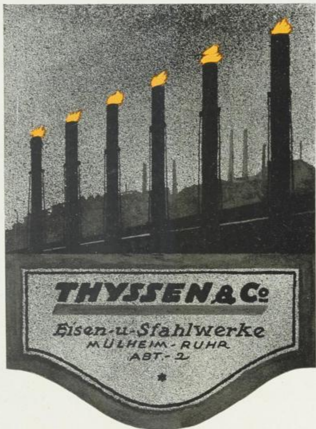
Bild 20 / / Anzeige