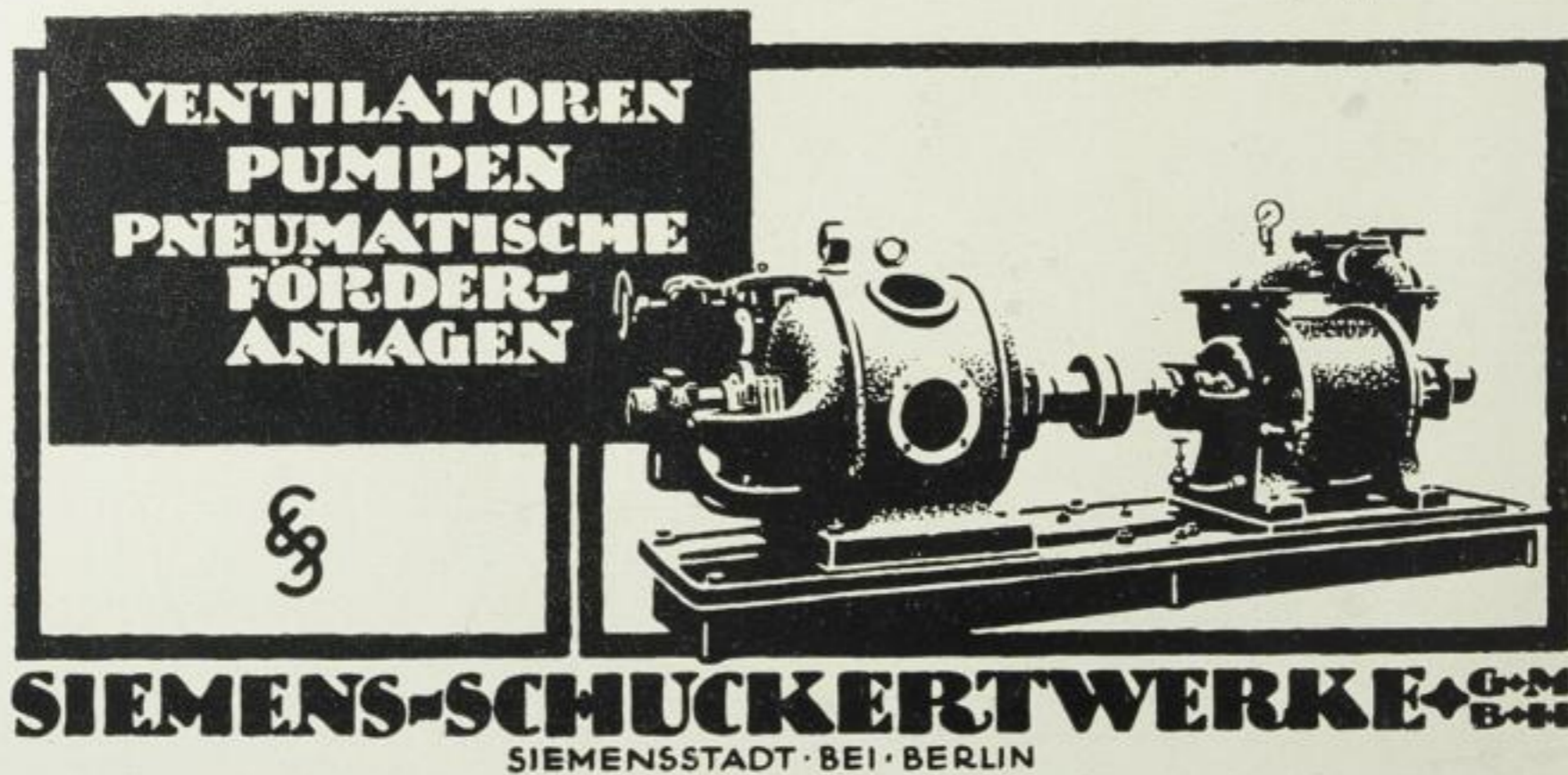
Bild 28 Anzeige