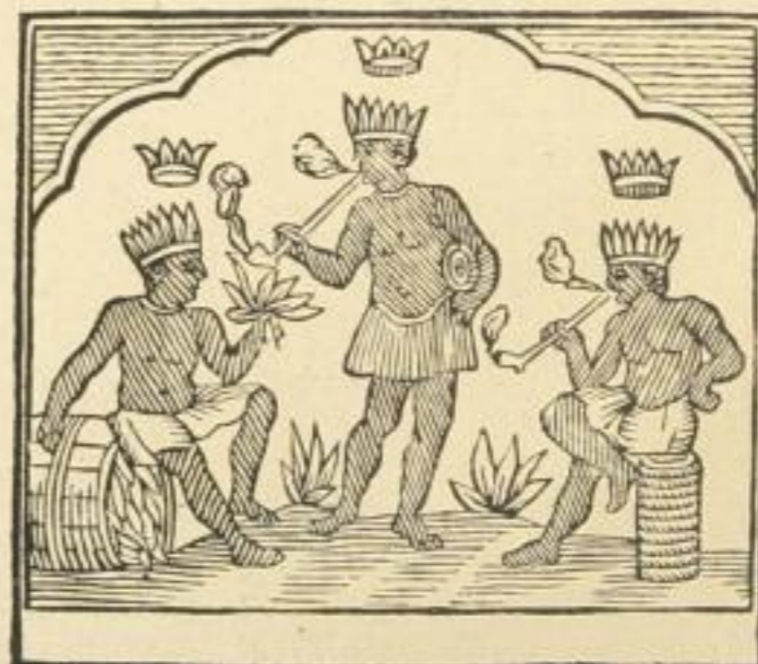
Die „drei Morianer“