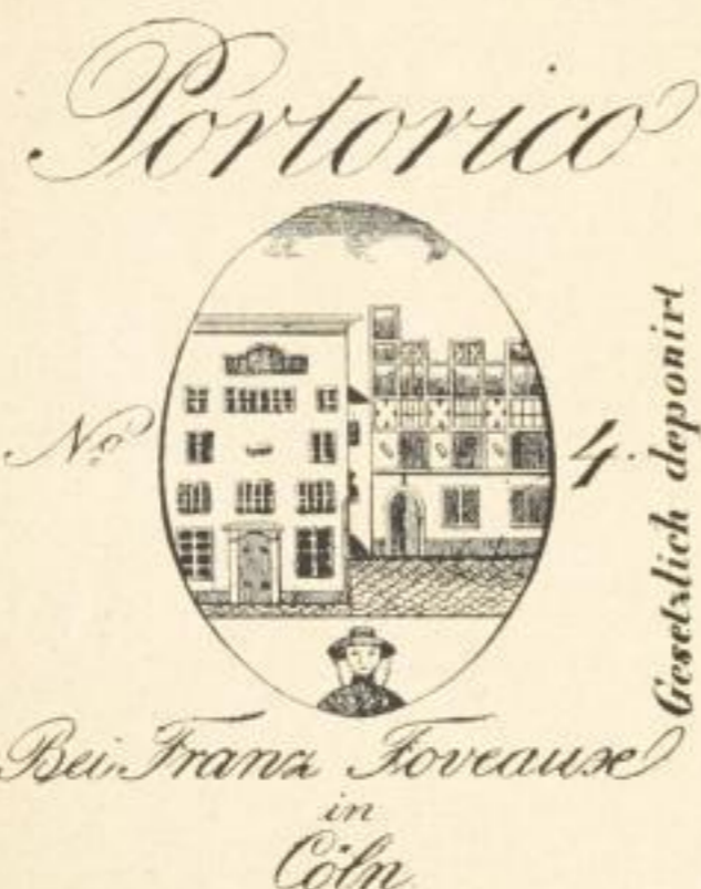
Zum Cardinal, Köln

Es ist zugleich ein Beweis dafür, daß ein solches Zeichen