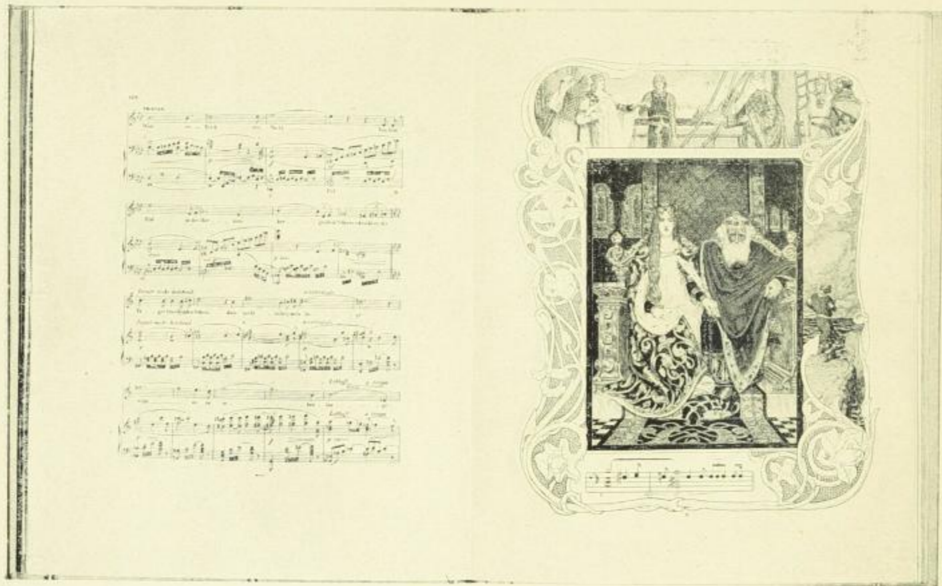
Bild 65 / Aus „Richard Wagners Tristan und Isolde. Mit Bilderschmuck von Franz Sassen.“ Druck und Verlag von Breitkopf & Härtel, Leipzig. Um 1900.