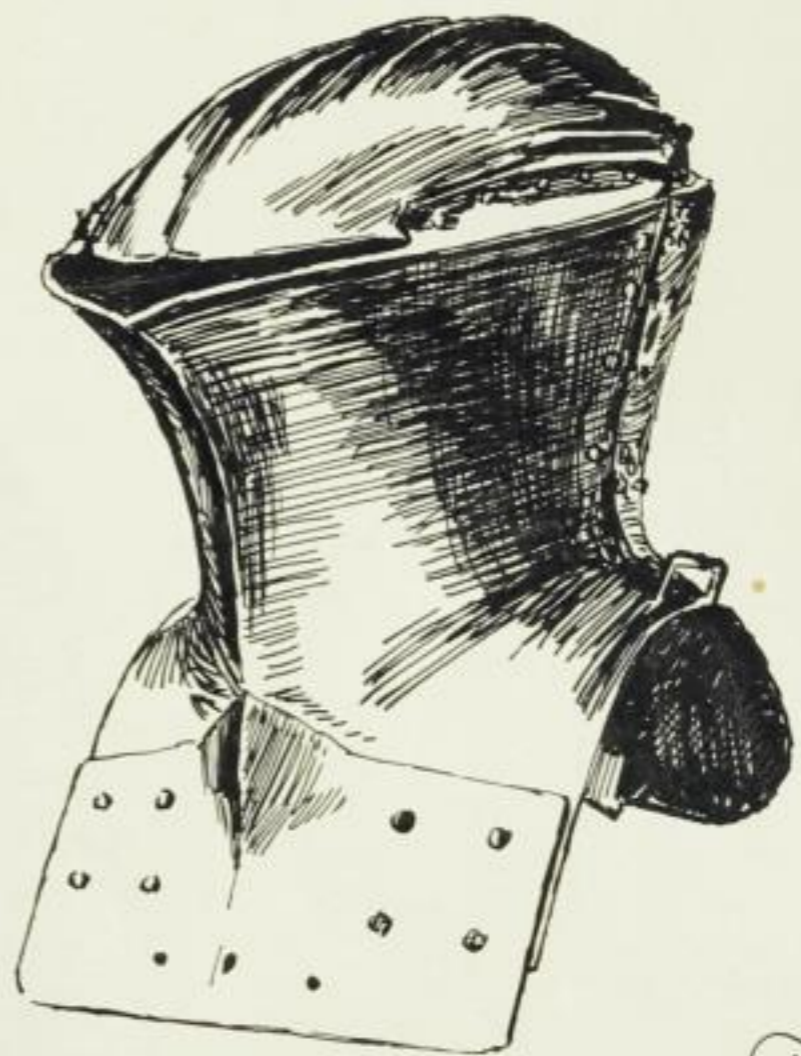
Ansicht im Halbprofil