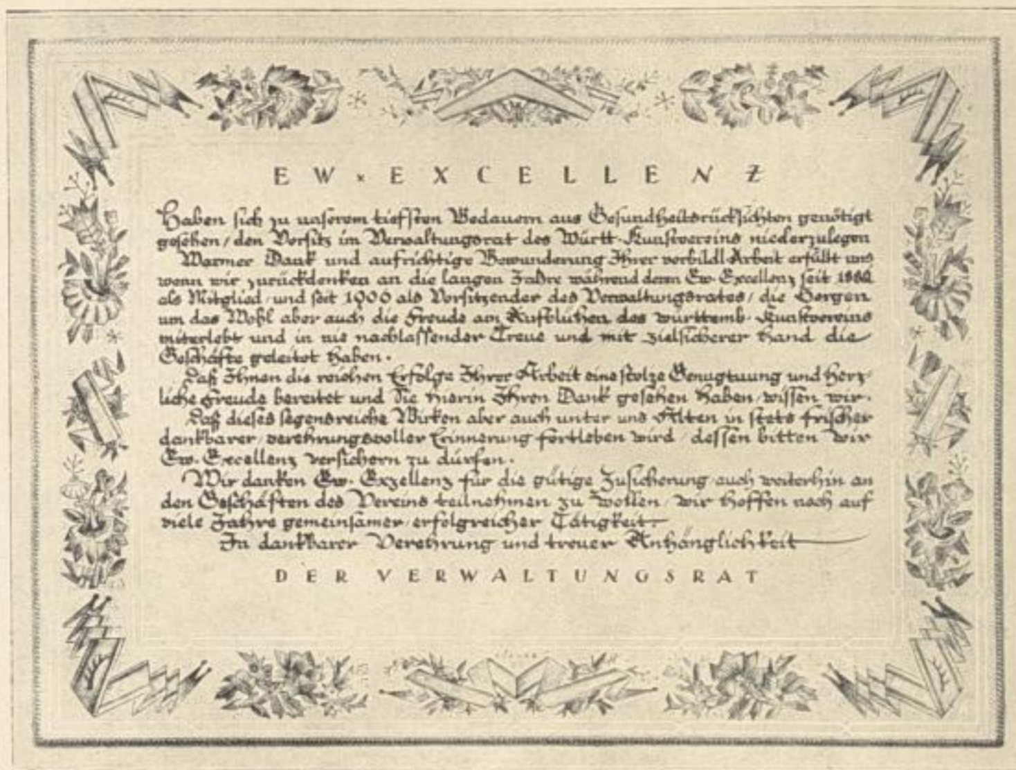
Bild 72 / MAX KÖRNER / Urkunde auf Pergament. Schwarz, grau, gold, blau

oder Avenarius im gegenwärtigen Augenblick noch nicht an dieser Stätte nachweisen können, so wird sich im Laufe der Jahre in anderem Zusammenhang schon noch die Gelegenheit finden, auch diese Lücke zu schließen. Heute handelte es sich nicht darum, mit erschöpfender Vollständigkeit ein Bilder-