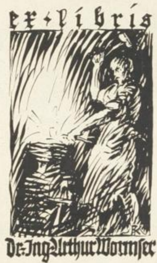
Bild 11-13 • Rudolf Koch • Verlagszeichen Wolfgang J. Mörlins, Berlin, 1919 • Ex libris Schenck 1908, Dr. Wormser 1920