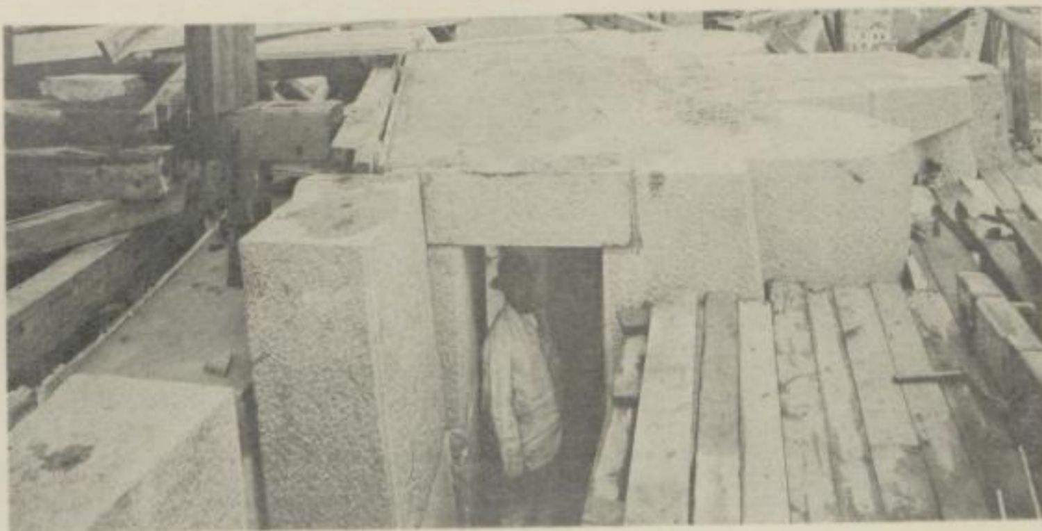
Sockel für eine der 12 m hohen Außenfiguren (August 1910)