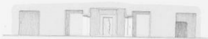
Durchschnitt nach a b.