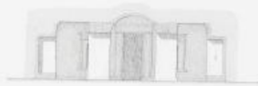
Durchschnitt nach c d.