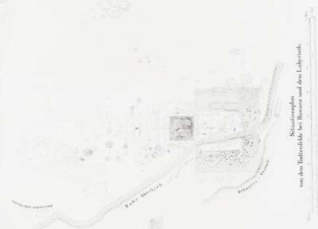
Situationsplan von dem Hofplatze bei Bovera und dem Labyrinth.