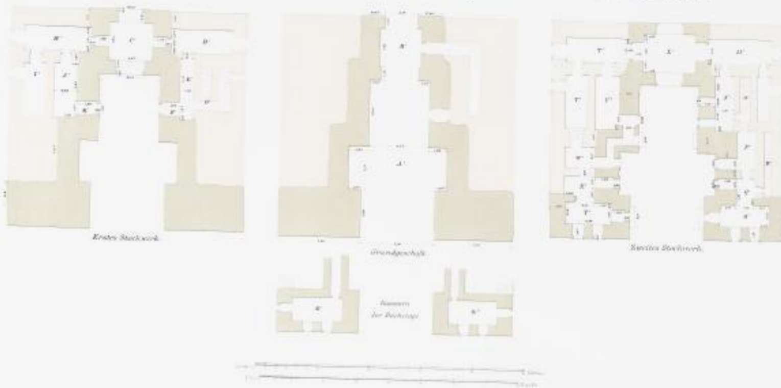
M.M. Tempel am südlichen Ende des Sees.