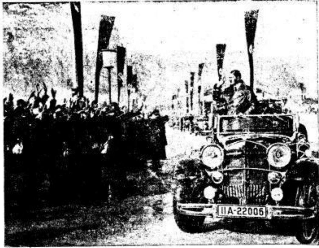
Ober: Der Führer auf der Fahrt zum Eisstadion in Garmisch-Partenkirchen.