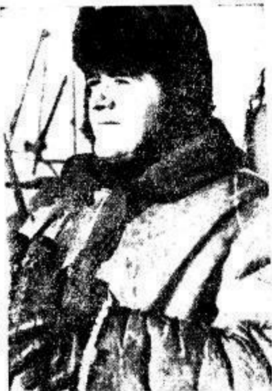
Kriegsmarinesoldat nördlich des Polarkreises.