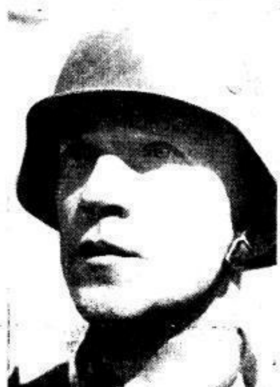
Wollen, kämpfen, siegen! Einzig erfüllt von diesem Gedanken gehen das deutsche Volk und seine Wehrmacht ins neue Jahr...