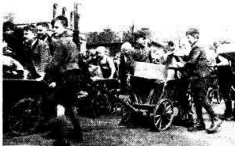
Wagenkolonnen rollen an — es hat sich gelohnt!

„Es ist schon halb sechs, ich muß zur Schule!“ Der kleine Pimpf laßt über unsere erkanteten Gesichtser „Warten Sie, ich muß noch mal schnell in den Keller!“