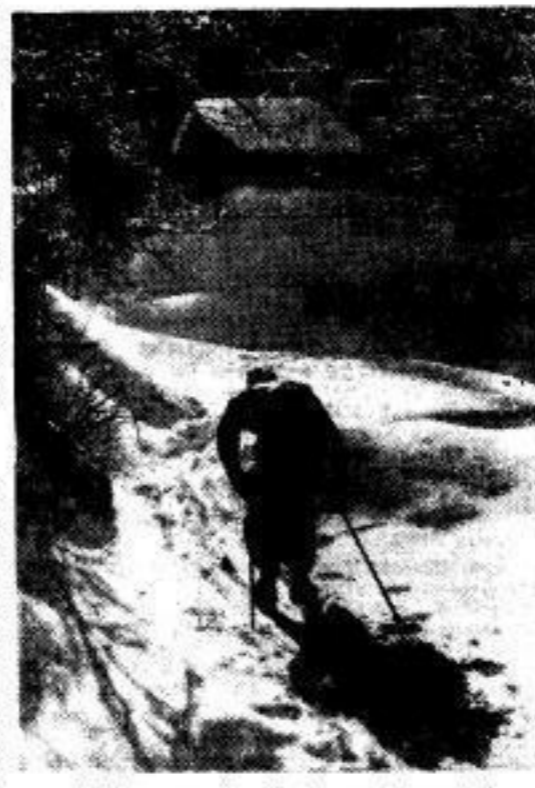
Abfahrt um die Sachsenmeisterschaft