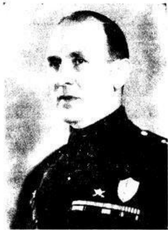
Botschafter Dino Alfieri

Gauleiter und Reichsstatthalter Mutschmann als Schirmherr der Deutsch-Italienischen Gesellschaft Dresdens nahm als erster das Wort. Er gedachte eingangs des unerwartet aus dem Leben geschiedenen Reichsgruppenführers, Staatssekretärs von Tschammer und Osten, der in seiner Eigenschaft als Präsident der Deutsch-Italienischen Gesellschaft Berlin die Anregung zur Gründung des Dresdner Zweiges gegeben hatte.