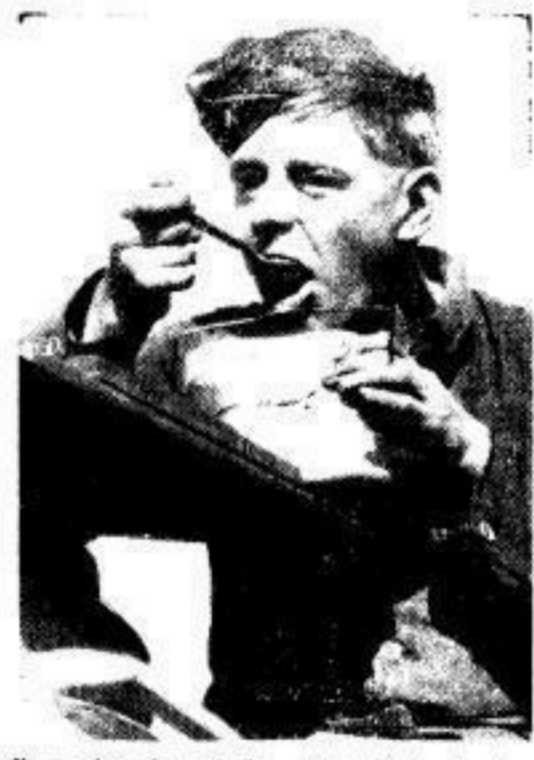
Ihm schmeckt es! Das „Nachtackchen“ einer Panzerbesatzung hat den größten Hunger.