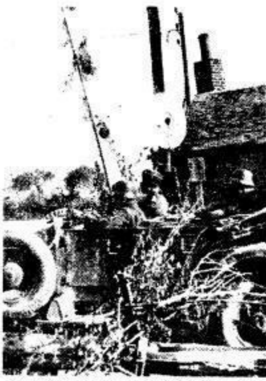
Am 10. Mai vor 3 Jahren. Deutsche Truppen beim Ueberschreiten der französischen Grenze.