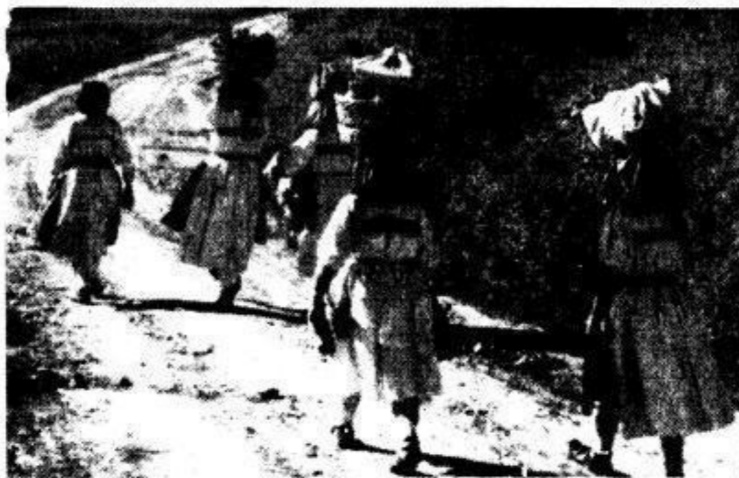
Bauerinnen aus der Gegend von Agram auf dem Wege zum Markt.

In früheren Zeiten hat in Kroatien, vor allem während der jugoslawischen Aera, das Wort von der bäuerlichen Demokratie eine große Rolle gespielt und man versuchte, sie in einen Gegensatz zum autoritären Staatsgedanken zu stellen. Die jetzt eingeleiteten Maßnahmen der kroatischen Regierung zur Neuorganisation des Bauern-tums auf alten, dem Volksbrauch entstammenden Grundlagen, beweisen, daß sich die autoritäre Staatsform in Kroatien sehr wohl mit einer richtig verstandenen bäuerlichen Selbstverwaltung vereinbaren läßt.