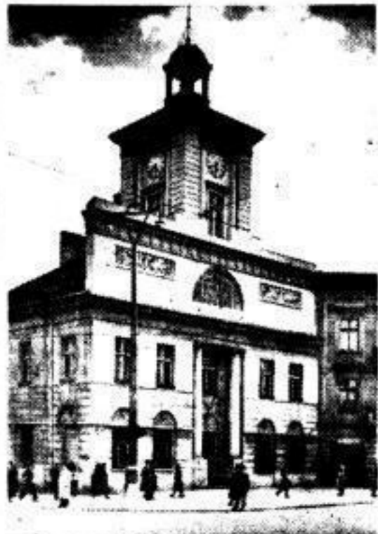
Das deutsche Rathaus von 1823, das ebenso in Schlesien oder Mitteldeutschland stehen könnte. Aufn.: Wb.

Dieser „Textilrausch“, diese russische Sucht zur Abnormität, dieses krasse Emporschnellen vom Bauerndorf zur Fabrikgroßstadt gibt noch dem Litzmannstadt von heute das Gepräge: ein schachbrettartig angeordnetes Steinmeer, überlagert von unzähligen Fabrikschornsteinen, ohne Grün, ohne Wasserlauf und ohne Forsten, plötzlich aus der endlosen Ebene aufgeschossen. Man kann das Stadtbild von Litzmannstadt, wie es infolge der künstlichen Industrialisierung mit allen ihren Schattenseiten gewachsen ist, am ehesten amerikanisch nennen. Kilometerlang und eintönig ziehen sich die Straßen hin. Möglichst schnell, möglichst billig, möglichst rationell ist hier von Jahrzehnt zu Jahrzehnt mehr „Wohnraum erstellt“ worden, für eine ständig wachsende Bevölkerung. Amerikanisch wurde im alten Lodz