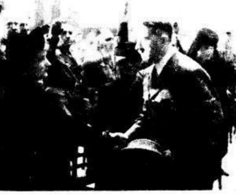
Vom Parteitruaerakt für Stabschef Lutze