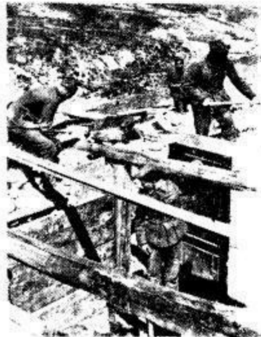
In den Kalkbergen des Nordwest-Kaukasus ist der Bau von Stellungen sehr schwierig. Wenn ein Bunker aber erst einmal fertig ist, kann er so leicht nicht außer Kampf gesetzt werden, auch wenn die Gegenseite schwere und schwerste Waffen verwendet.

Die norditalienischen Blätter begründen in ausführlichen Artikeln den Anspruch und das Recht Italiens auf den afrikanischen Boden. Sidrija Umhände, so schreibt Appellius im „Popolo d'Italia“, lassen den Jahrestag der Proklamation des italienischen Imperiums mit dem letzten deutsch-italienischen Widerstand in Tunesien zusammenfallen. Ein weniger starkes Volk als das italienische hätte diesen Tag schweigend begangen, um nicht seine Dramatik zu unterbrechen; wir dagegen beschäftigen uns neue unieren sehtenen Willen, ein Imperium zu besitzen, und unsere Gewißheit, die Tricolore nicht nur wieder aber dem Imperium von gestern, sondern sogar auf dem noch größeren Imperium von morgen und übermorgen wehen zu sehen.