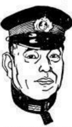
Isoroko Yamamoto Dehnen Dienst

In wenigen Tagen jährt sich zum 38. Male jener herrliche Sieg der japanischen Flotte bei Tsushima, der, verbunden mit dem Namen ihres heldischen Admirals Togo, unvergänglich in der Geschichte des japanischen Kaiser-