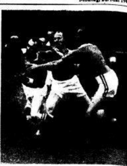
Trotz starker Behinderung ...