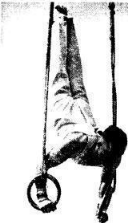
Diese 36 scharf Metallgehänge, wie hier an den Ringen...