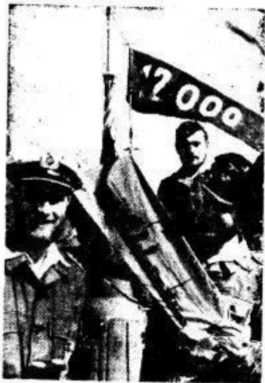
Zurück aus der Geleitzugschlacht. Die Siegeswimpel am Seehorizont: Ein Tanker von 12 000 BRT. und ein englischer Zerstörer. Links der Kommandant.

Mit unveränderter Treue barre Ungarn an der Seite Italiens und Deutschlands aus, der in der Zeit nach Trianon sich zuerst auf die ungarische Seite gestellt habe. In Erkenntnis des Rechts und in Verteidigung unseres Volkes stellten wir uns, so erklärte der Ministerpräsident, dem Völkern, neben das Deutsche Reich und Oester, der die Fesseln von Trianon zerprengte und so die Erreichung unserer historischen Rechte ermbilligte und der allein Europa vor dem Bolschewismus retten kann.