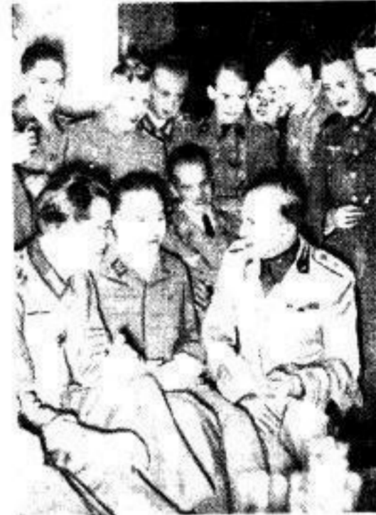
Botschafter Alfieri empfing deutsche Verdiente

Deutsche U-Bootverbände versenkten im Mittelmeer in schweren Kämpfen aus stark gesicherten Geleitzügen drei Schiffe mit 15 000 Bruttoregistertonnen.