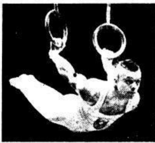
Als die Turnhalle leer war, war leichter zu beobachten, an der Spitze des Turnens...