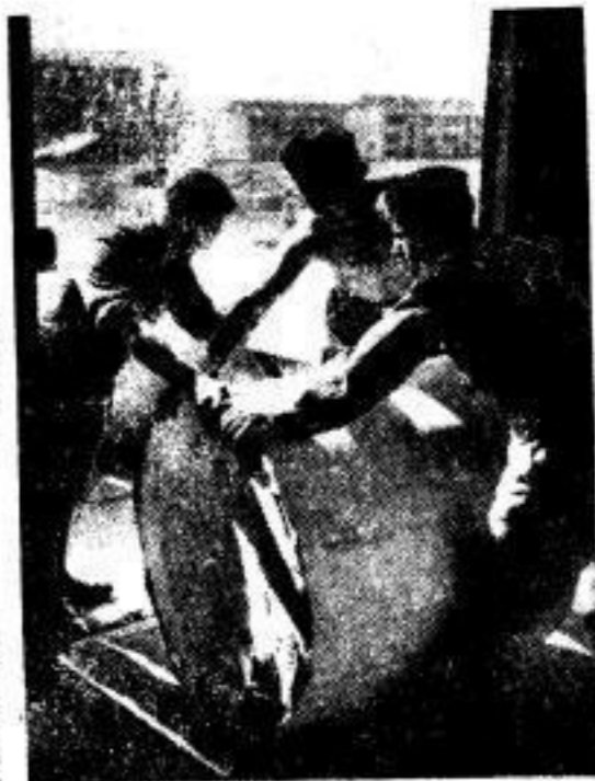
Die Frontzeitung braucht Papier. Soeben ist ein neuer Transport Zeitungspapier eingetroffen und das Ausladen der schweren Rollen ist im vollen Gange.