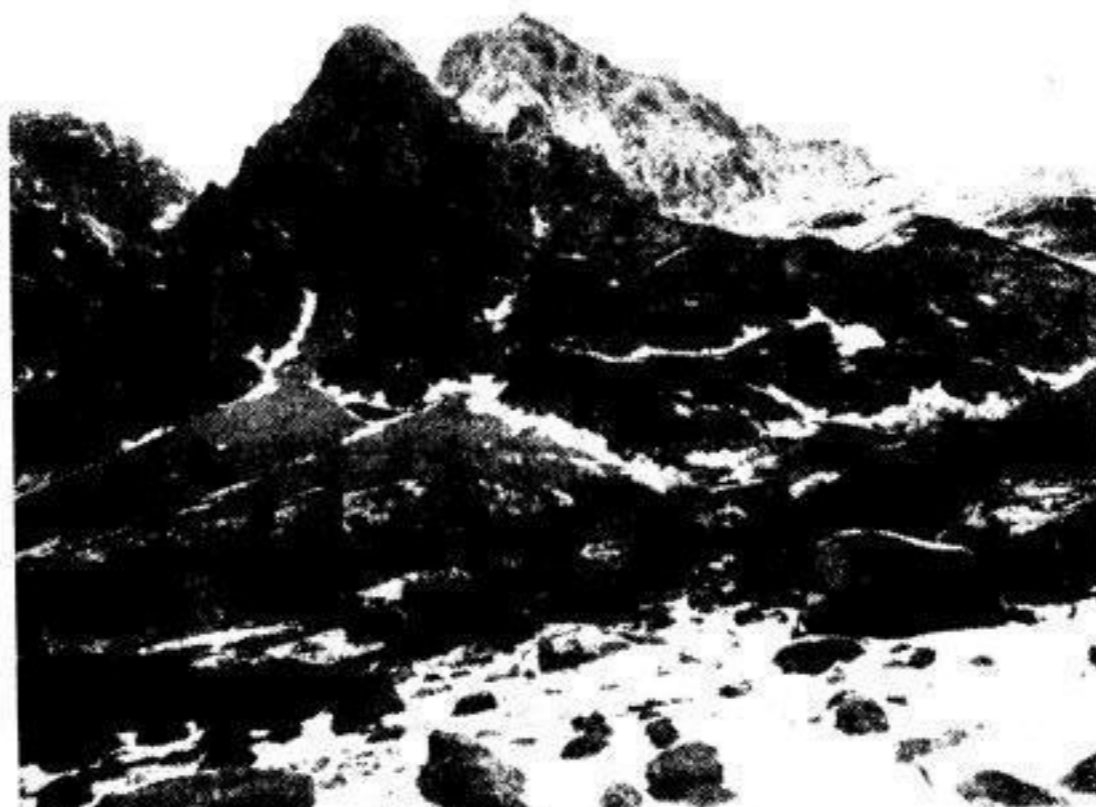
In urweltlicher Einsamkeit ragt der Gran Sasso, das königliche Haupt der Abruzzo, empor

Der Duce hat einen Tagesbefehl Nummer 6 erlassen, der folgenden Wortlaut hat: „Tagesbefehl der Regierung Nummer 6: In Ergänzung der vorhergegangenen Tagesbefehle beauftrage ich den Generalleutnant Renato Ricci mit dem Oberbefehl der freiwilligen Miliz für die nationale Sicherheit. Mussolini.“