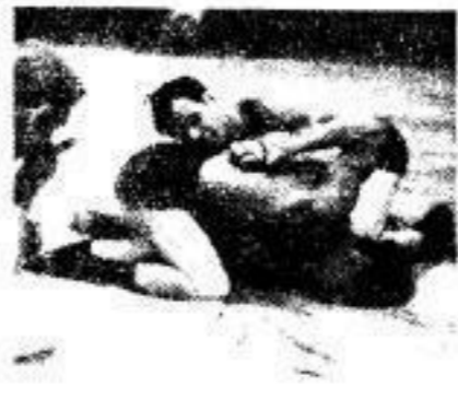
Bingen, der Kraftsport der Männer und der Jungen... Vom Weitermachen 1942/43...