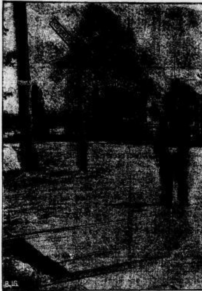
Signalkreuz bei Bahnübergängen in Amerika. (Mit Text.)

abgebrannt kann er auch noch nicht sein, denn —“ Es folgten die Brillantnadel, die tadellose Kleidung und das fraglos zur Verfahrt benötigte Abteil zweiter Klasse als Beweise für diese letzte Behauptung.