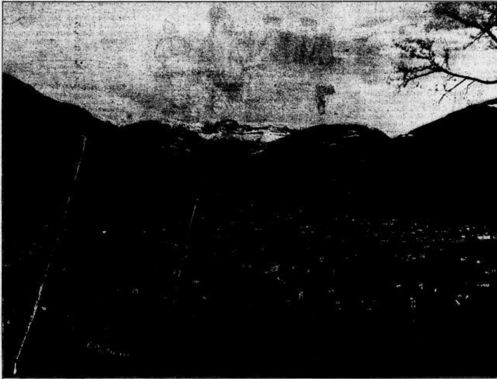
Weinbergkreuz am Altenberg. Bild auf Bozen und den Rosengarten. (Mit Text.)

Darauf eilte er schleunigst in die Druckerrei, wo er die Theaterzettel bestellen wollte, und ließ recht auffällig unter den Titel der für morgen anstehenden Oper drucken; „Als Gast gewonnen der berühmte Heldentenor Bobo Pelter aus Köln“, sorgte auch dafür, daß dieselbe Nachricht mit allerlei Zusätzen versehen, so: „der seine Ausbildung bei dem hervorragenden Musikprofessor Merg ge-