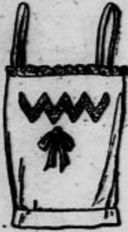
Nr. 13021. Nieder zu 13018-20 passend.

Nr. 13022. (Erforderliches Material: etwa 1,25 m Stoff 100 cm breit.) Das vorliegende Schlupfhöschen ist äußerst einfach. Beide Beinlinge sind durch Seitennaht verbunden, die am offenen Rande durch Blenden gesichert sind, sodann werden die Bündchen mit Knopfschluß aufgesteppt. Dem rückwärtigen Teil ist eine Tasche angeknüpft, welche auslanggethiert und überknüpft wird. Spitze berandet die Beinlinge.