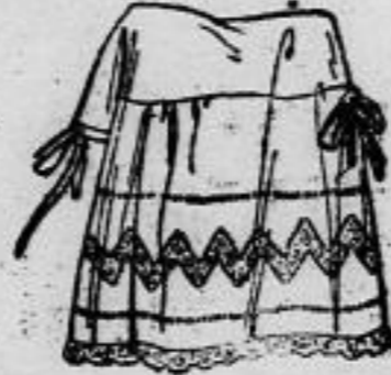
Nr. 13018. Taghemd. — Nr. 13019. Nachthemd. Nr. 13020. Unterrod mit übereinstimmender Garnitur.