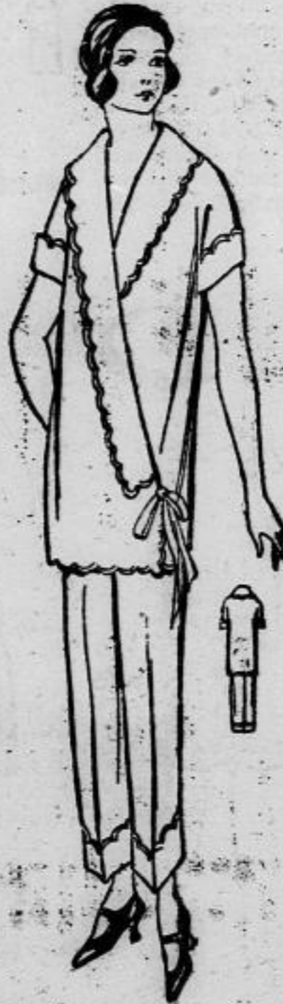
Nr. 13024. Eleganter Schlafanzug mit Langettenbogen aus lachsrosa Wäsche.

Nr. 13023. (Erforderliches Material: etwa 0,75 m Stoff 0,84 cm breit.) Aus Renforcé ist die schlichte Hemdhose gearbeitet, welche geschlüpft wird. Der obere und untere Rand — letzterer wird in der Mitte zusammengefaßt — werden mit Langetten berandet; übereinstimmend sind die Träger der schlichten Hemdhose.