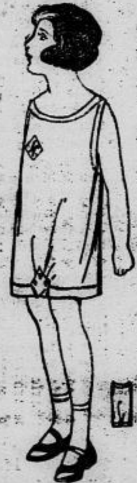
Nr. 13025. Hemdhose mit Hohlnähten für 6-8 jähr. Mädchen.

Nr. 13025. (Erforderliches Material: etwa 1 m Battist 100 cm breit.) Die einfache Hemdhose aus Makobattist wird auf der Kapsel geknöpft. Den Halsausschnitt begrenzt Hohlfaum, welcher sich an den Ärmelböhern fortsetzt und auch den unteren geraden Rand ziert. Angeknüpfte Tasche.