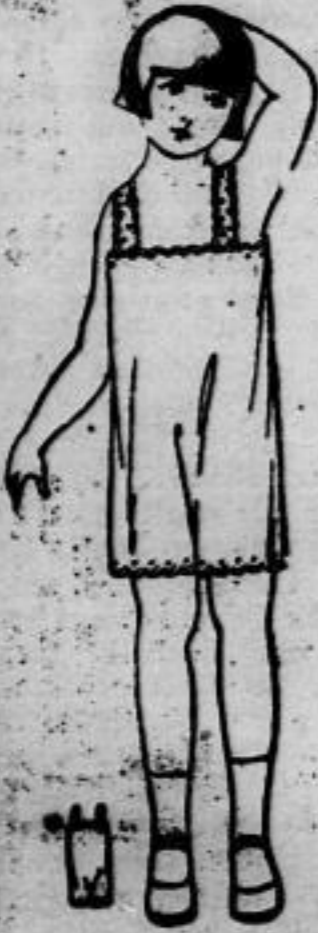
Nr. 13023. Hemdhose & Schlüpfer für 4-6 jährige Mädchen.

Nr. 13021. (Erforderliches Material: etwa 0,85 m Stoff 100 cm breit.) Vorstehende Garnitur vervollständigt das Reibchen, welches aus einem geraden Stoffstreifen gebildet und im Rücken geschlossen wird. Neben dem Zwischensatz garniert den oberen Rand passendes Spitzen, während unten ein gerader Schößstreifen angefügt ist.