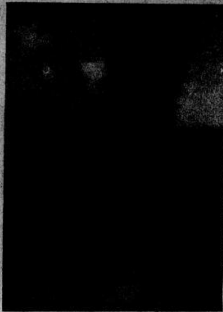
Deutsche Wolkenkratzer (Atlantic) Nicht nur Amerika strebt mit seinen Bauten immer mehr nach dem Himmel, sondern auch Deutschland eifert diesem Vorbilde nach und es entstehen in Großstädten Deutschlands Gebäude von einer Höhe, die man sich in Vorkriegszeiten nicht hätte träumen lassen. In Köln wurde soeben ein Hochhaus vollendet, das zweite im Rheinlande. — Das neue Hochhaus in Köln auf dem Hansaring nach der Vollendung