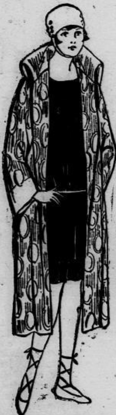
Nr. 13192. Einfacher Bademantel mit eingesehten Ärmeln. Nr. 13193. Eleganter Bademantel aus gestreiftem Frotte.

Nr. 13192. (Erforderliches Material: etwa 2 m gemusterter Frotte 1,70 cm breit, 0,80 m einfarbiger Frotte 140 cm breit.) Gelblicher Kräuselstoff mit hellblauer Musterung ergab