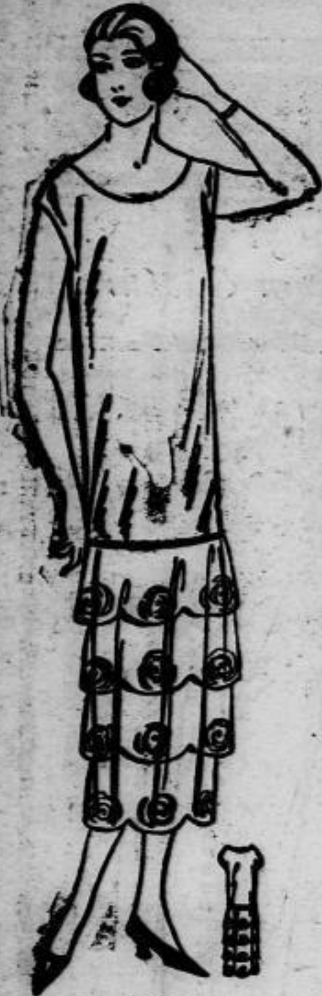
Nr. 13188. Hochsommerkleid mit Volantrod.

Nr. 13189. (Erforderliches Material: etwa 3,75 m Stoff 90 cm breit.) Welcher Schleierstoff ergab zu obenstehendem, nachahmenstwerthen Kleide das Material. Die hemdartige Bluse ist ärmellos und wird geschlüpft. Dem schlichten Rock sind zwei gerade Falbeln aufgesetzt, die am Rande ausgehogen sind, desgleichen der Rockrand. In jeden Bogen ist ein Schilderemotiv, eine Rose darstellend, in farbigem Seidentwist eingestickt. Der oberste Volant ist mit dem Rock zusammen durch Hohlwaht der Bluse in Hüfthöhe angelegt. Die übrigen Falbeln sind unsichtbar ausgebrocht.