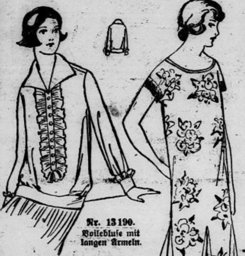
Nr. 13190. Kollebluse mit langen Ärmeln.

Nr. 13191. (Erforderliches Material: etwa 2,75 m gemusterter Stoff, 0,65 m einfarbiger Stoff je 100 cm breit.) Das elegante Kleid setzt sich aus geblühter und glatter Vassfelde zusammen. Für die schlichte Hemdform des Kleides ist die geblühte Seide verwandt. Die kurzen angeschnittenen Ärmel schließen mit einfarbigen Blenden ab, ein gleicher Baspel sichert den Halsauschnitt. Neuartig sind die teilig angelegten Telle, für welche das Kleid bis Hüfthöhe eingeschnitten und dann durch einfarbige Seide ergänzt.