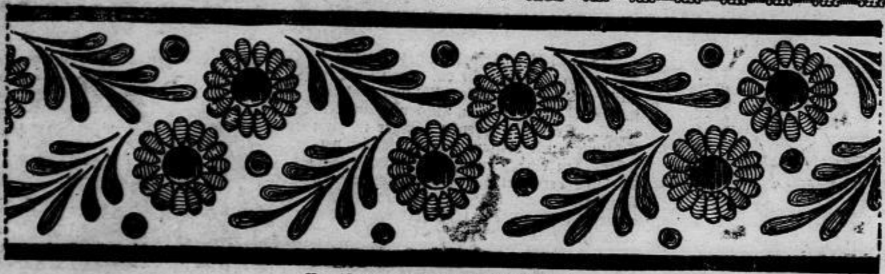
Nr. 13199. Vorbüre in Buntstückerel.

Nr. 13199. Die obenstehende Vorbüre eignet sich vorzüglich zur Verzierung von Sommerkleidern und Blusen, als Abschluss für Kasacks und auch Kinderkleidern. Die Blüten sieht man abwechselnd in gelbem, rosa und blauem Plattstich mit bräunlichem Kelch, für die Blätter verwendet man ein bis zwei grüne Töne. Die Abschlusslinien müssen mit der Farbe des Stoffes gut harmonieren.