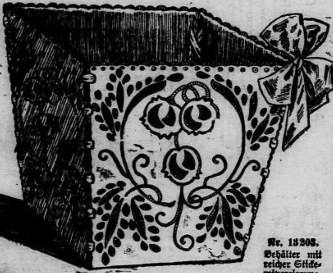
Nr. 13203. Behälter mit reicher Stückerelverzierung.

Nr. 13203. Der reizende Behälter ist zur Aufnahme von Hand- resp. Bildarbeiten gedacht. Reiche Lochstückerel ziert die vier Seiten, deren seitliche und oberen Ränder langetten abschließen. In gleicher Größe schneidet man vier Pappen, beklebt sie von beiden Seiten mit Satin