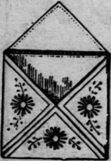
Nr. 13200/01. Taschentuch und Kragebehälter für die Reise.

Nr. 13199. Die obenstehende Vorbüre eignet sich vorzüglich zur Verzierung von Sommerkleidern und Blusen, als Abschluss für Kasacks und auch Kinderkleidern. Die Blüten sieht man abwechselnd in gelbem, rosa und blauem Plattstich mit bräunlichem Kelch, für die Blätter verwendet man ein bis zwei grüne Töne. Die Abschlusslinien müssen mit der Farbe des Stoffes gut harmonieren.