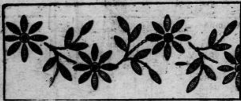
Nr. 13319. Weißstickerei zur Verzierung von Wäsche.

Nr. 13318. Der elegante Teewärmer zeigt auf beiden Seiten verschiedene Spitzenstickmuster. Diese werden durch Spann- und Schlingstiche gebildet und zwar lose auf dem darunter liegenden Muster, so daß dieses nach Fertigstellung entfernt werden kann. Einem feinen Seidenfutter mit Watteung wird es sodann ausgearbeitet. Gezogene Rüsche und Bandschleife vervollständigen den weiß gefütterten Wärmer, der ein empfehlenswertes Geschenk darstellt.