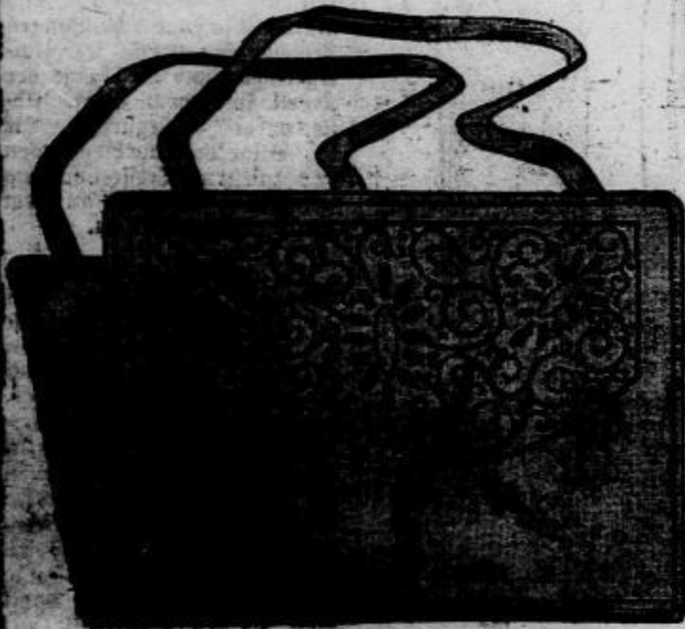
Nr. 13321. Rucksack mit Stickerstickerei.

Nr. 13322. Aus verschiedenen Resten ist das Deckchen hergestellt. Der mittlere Stern sowie die vier äußeren Ecken sind aus hellblauem gestreiften Stoff aufgesetzt. Schmales Band sichert die Ränder und wird durch farbige Vorstücke gehalten. Die Blätter werden im Plattstich ausgeführt. Punkte vervollständigen das Innere.