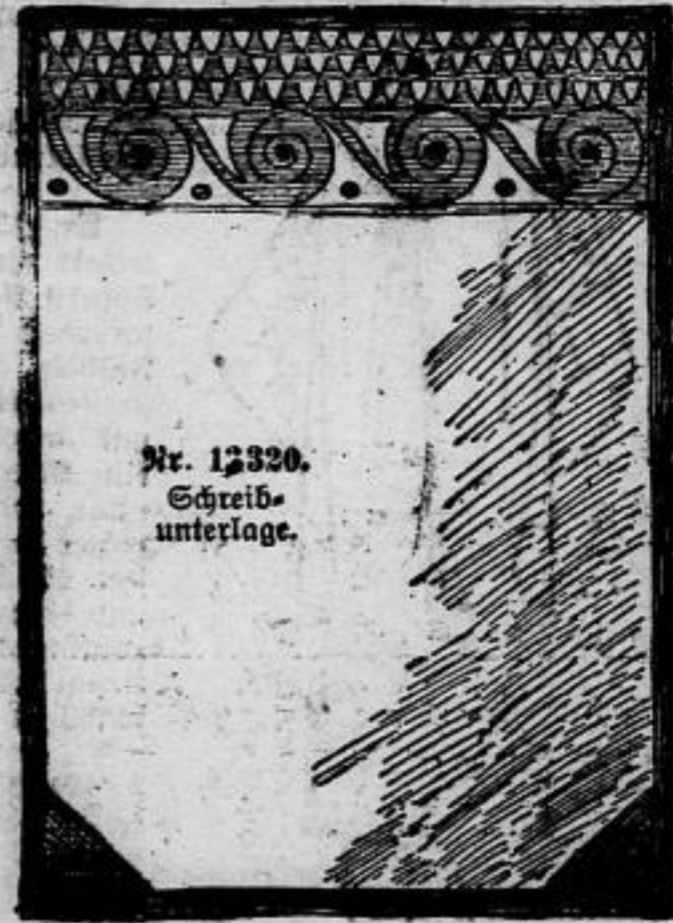
Nr. 13320. Schreibunterlage.

Nr. 13320. Die Schreibunterlage stellt ein willkommenes Reisegeheim dar, welches in der Sommerfrische gar bald angefertigt ist. Der obere Stickerstreifen ist aus feinem modifarbenem Leinen hergestellt.