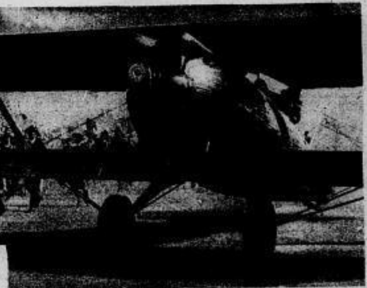
Die Landung der japanischen Weltflieger in Berlin wo sie von der japanischen Kolonie mit besonderem Jubel aufgenommen wurden. Die Flieger haben, von Japan kommend, ganz Sibirien überquert und wollen ihren Flug über Amerika weiter nach ihrem Heimatlande fortsetzen