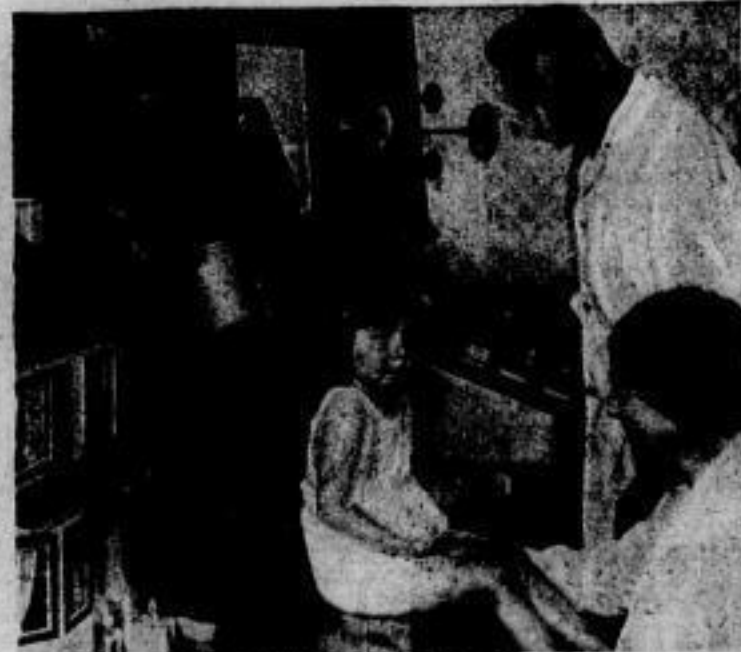
Beseitigung von Körperverkrümmungen durch X-Strahlensoll in England mit bestem Erfolg besonders bei Kindern durchgeführt sein

Links: Eine seltene Beute Ein 200 Pfund schwerer Sägefisch, welcher mit Angel und Harpune an der amerikanischen Küste gefangen wurde