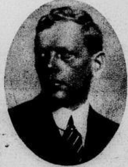
Prof. Knappertsbusch der Generalmusikdirektor der Münchener Oper, ist ein vielgeehrter Dirigent. Er hat u. a. aus den meisten Hauptstädten Europas Einladungen zu Gastspielen erhalten.