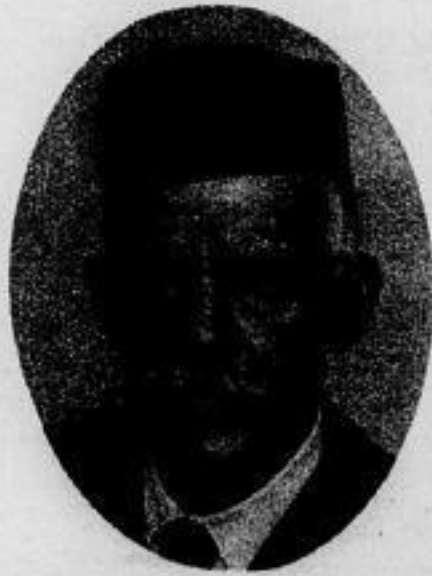
Prof. Georg Schweinfurth der berühmte deutsche Afrikaforscher, starb in Berlin im 89. Lebensjahre. Schweinfurth hat große Teile Mittelfrikas entdeckt, durch seine vielseitigen Fähigkeiten auch der Wissenschaft große Dienste geleistet.